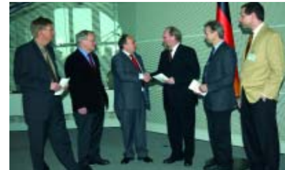
Bundespräsident Wolfgang Thierse signalisierte bei der Übergabe des Entwurfes Zustimmung zum Gesetz

In der neuen Legislaturperiode wurde der mühselige Prozess der Ressortabstimmung wieder aufgenommen. Da sich an der Grundkonstellation nichts geändert hatte, war der Stillstand vorprogrammiert. Die Ministerialbürokratie kam dabei zugute, dass es an öffentlichem Druck für das