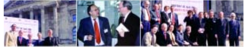
Eine gemeinsame Aktion von netzwerk recherche, DJV, dju in ver.di, TI und HU

„Da könnte ja jeder kommen“, ist ein beliebter Satz der Informations-Verhinderer in deutschen Amtsstuben. Für alle, die sich hinter dieser abwehrenden Formulierung verschansen, muss das sogenannte Informationsfreiheitsgesetz, kurz IFG, eine echte Bedrohung ihres Herrschaftswissens sein: Das Gesetz würde es tatsächlich jedem erlauben, die bei öffentlichen Stellen vorhandenen Akten einzusehen. Eine eigene Betroffenheit muss dafür nicht nachgewiesen werden,