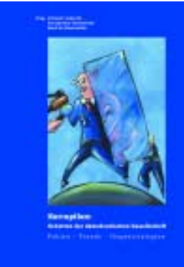
Die Ergebnisse und Texte zur nr-Fachtagung können unter www.netzwerkrecherche.de heruntergeladen werden.

Vielfach ist diese sogar das eigentliche Problem. Denn die Lokaljournalisten sind eingebunden in das lokale Beziehungsgeflecht der Eliten. Jeder kennt jeden und oft gibt es intime Verbindungen zwischen der örtlichen Zeitung, der Politik und den Unternehmen, die unter Korruptionsverdacht geraten. Viele Lokaljournalisten trauen sich hier nicht mehr zu recherchieren und nachzuhaken, weil sie fürchten, dass dies ihren Job kosten oder ihre Informationszugänge blockieren kann.