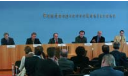
Der Gesetzesentwurf wurde der Bundespressekonferenz vorgestellt.

Reporter einem Korruptionsfall auf der Spur ist, kann er den Akteneinsichtsantrag problemlos als Privatperson stellen, weil das IFG ein „Jedermannsrecht“ ist. Behördenmitarbeiter werden somit nicht von vornherein so stark alarmiert wie es bei Anfragen geschieht, die erkennbar aus journalistischem Interesse heraus gestellt werden.